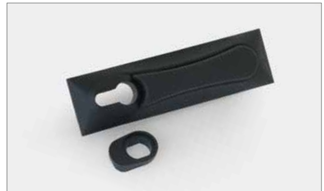
Der alte Plasteschwenkhebelgriff nebst Zubehör ist auf Anfrage erhältlich.